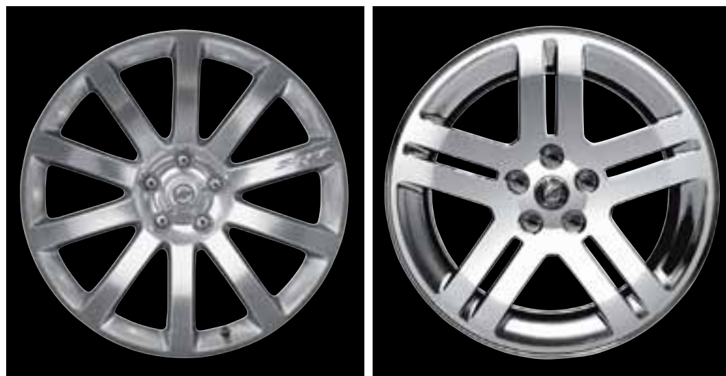
A Llantas de Aluminio de 20" SRT8